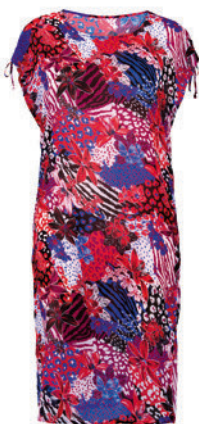
Art. 8620.554 Lucca S-XL 69,95 €