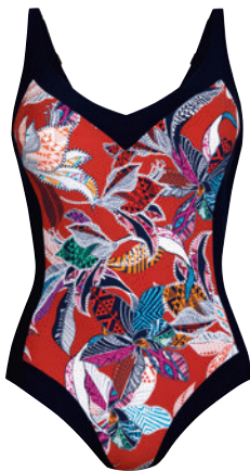
Art. 7335.344 Sidonia Cup B-C, 38-60 Cup D-E, 38-56 Cup F, 38-52 Cup G, 38-48 Cup H, 38-44 99,95 €