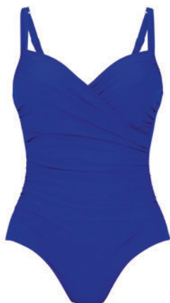
Art. 7300.338 Tilda Cup C-E, 38-50 Cup F, 38-48 129,95 €