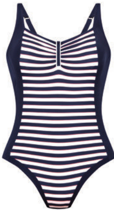
Art. 7320.426 Alena Cup B-D, 38-52 99,95 €