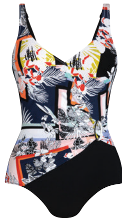
Art. 7348.009 Elea Cup C-E, 38-52 Cup F-H, 38-48 119,95 €