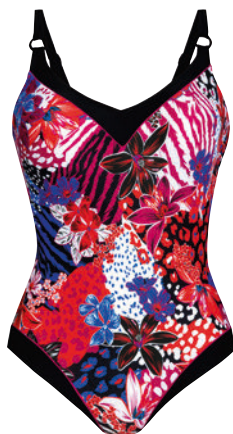
Art. 7239.554 Mara Cup B-E, 38-50 119,95 €