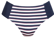
Art. 8420.426 Selena Cup B-D, 38-50 99,95 €