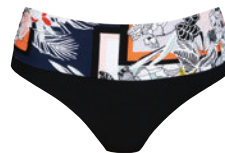
Art. 8448.009 Sibel Cup C-D, 38-54 Cup E-H, 38-46 Cup I, 38-44 119,95 €