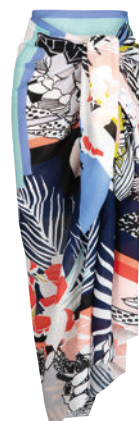
Art. 8111.009 Pareo 180 x 120 cm 69,95 €